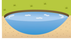
REGENWATERBUFFERING BASSIN DE STOCKAGE