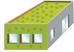
GROENDAKEN EN -GEVELS TOITURES ET FAÇADES VERTES