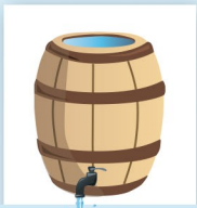
REGENWATERGEBRUIK UTILISATION D'EAU DE PLUIE