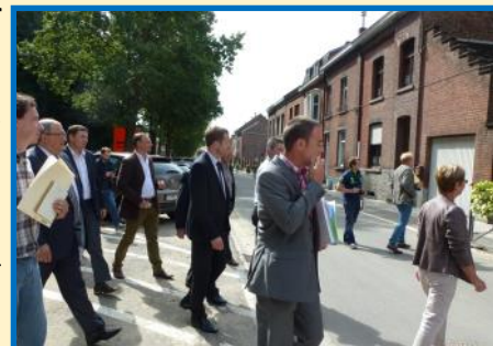
Visite de Paul Magnette à Ittre

Le 28 août, Monsieur le Ministre Président, Paul Magnette, est venu en personne à Ittre annoncer la décision du Gouvernement wallon de déclarer ces dernières inondations « catastrophe naturelle ». Ceci permet aux sinistrés d'avoir accès au Fonds des Calamités. Le but de sa visite était également de voir les dégâts engendrés à Ittre et de rencontrer l'équipe communale et les sinistrés. En effet, cette compétence « Catastrophes naturelles » a été transférée depuis le 1er juillet aux Régions, et Paul Magnette a assuré que les dossiers introduits seraient gérés le plus rapidement possible (avant la fin de l'année). Les sinistrés peuvent donc se renseigner auprès de leur administration communale afin connaître les modalités à suivre.